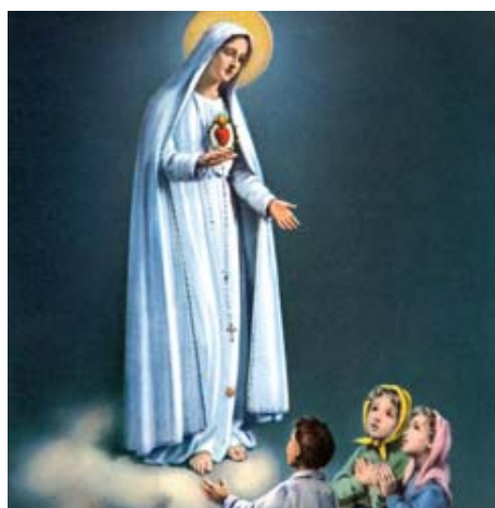
Nuestra Señora de Fatima, 13 de mayo.