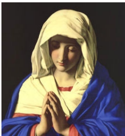
María Auxiliadora de los Cristianos, 25 de Mayo