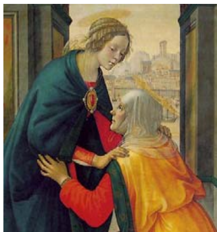
La visitación, 31 de mayo

Los cuadros aquí presentados son de María...y otra mujer. En el último se encuentran dos mujeres, María y Isabel, las dos embarazadas con la esperanza del universo en sus vientres. En el mes de mayo, el mes de María, tal vez uno esté tentado a ver a María como objeto de devoción. Sin embargo, en el último cuadro Ella está pintada como misionera y para nosotros, los marianistas, sigue siempre siendo así: misionera y quien nos invita a nosotros a participar en su